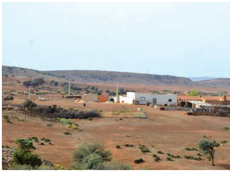
يقاطعون مقاعد الدراسة مبكراً بسبب نقص المواصلات وبعد المسافة، ما يدفعهم دخول حلقة البطالة وشبح الفراغ. ويشهد قطاع التربية والتعليم بهذه المناطق نقصاً كبيراً إن لم نقل انعداماً في المؤسسات التعليمية، إذ لا تتوفر على الإكاملات والثانويات، حيث يتنقل الطلاب إلى منطقة المالحة أو بلدية ابن زياد للحصول على العلم.

وتعاني هذه المنطقة التي يقطن بها حوالي 200 ألف نسمة إجمالاً من نقص المواصلات، إذ لا تتوفر سوى على 3 حافلات من النوع الصغير لا تستطيع نقل العدد الهائل لهذه المناطق، وهو الأمر الذي أثر سلباً على فئة شباب، الذين